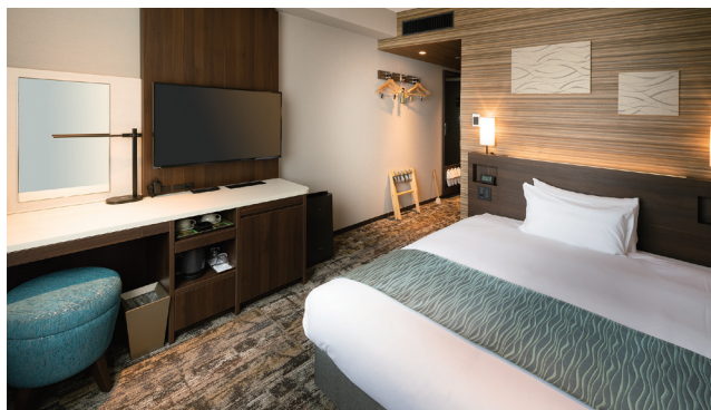
DOUBLE ROOM ダブルルーム 45室