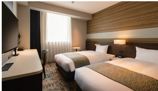
TWIN ROOM ツインルーム 36室