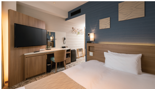
SINGLE ROOM シングルルーム 98室