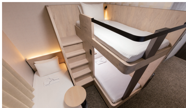
TRIPLE ROOM トリプルルーム 5室