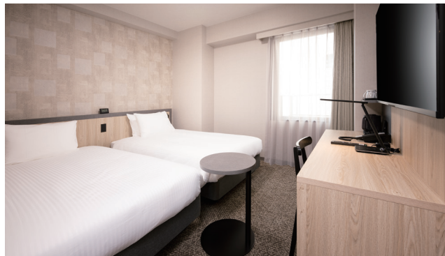
TWIN ROOM ツインルーム 28室