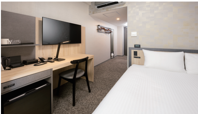
DOUBLE ROOM ダブルルーム 95室