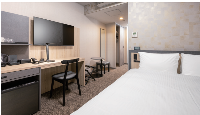
SUPERIOR DOUBLE ROOM スーパーダブルルーム 20室