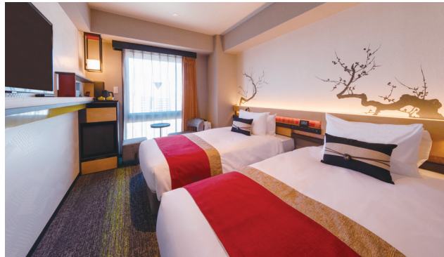
TWIN ROOM ツインルーム 54室

スーベリアシングルルームではマッサージチェアをご用意し、癒しの空間をご提供いたします。