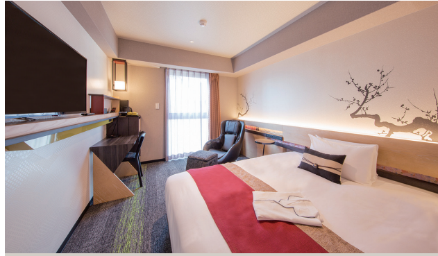
SUPERIOR SINGLE ROOM スーベリアシングルルーム 17室