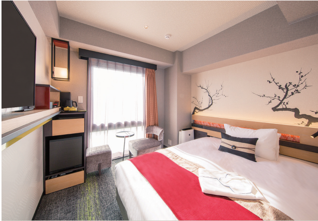
SINGLE ROOM シングルルーム 27室