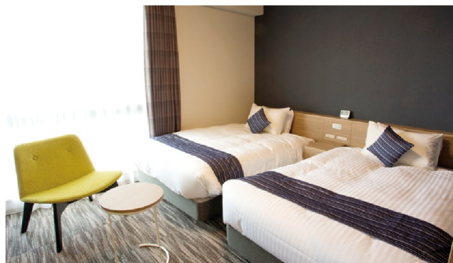
SUPERIOR TWIN ROOM スーベリアツインルーム 12室