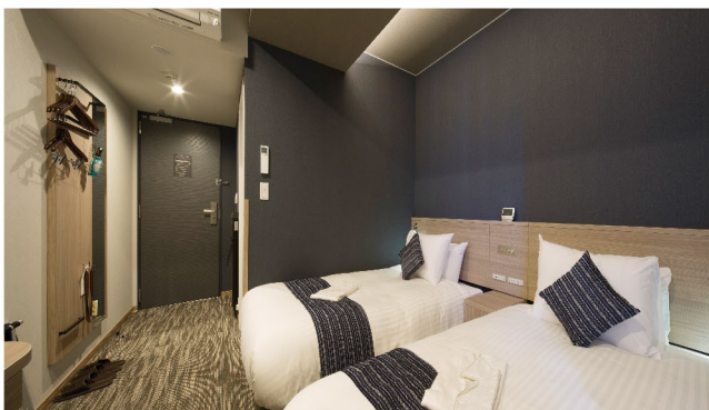
TWIN ROOM ツインルーム 11室