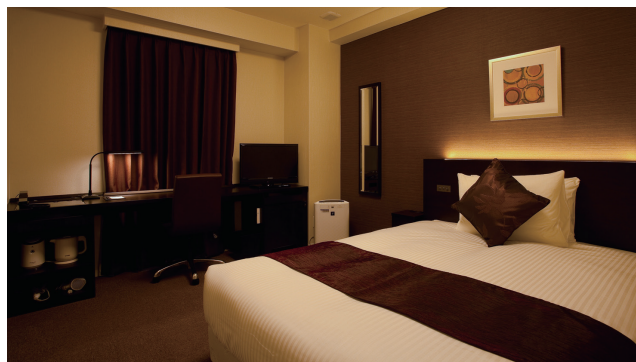
LADIES SINGLE ROOM レディースシングルルーム 27室