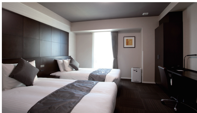
DELUXE TWIN ROOM デラックスツインルーム 10室