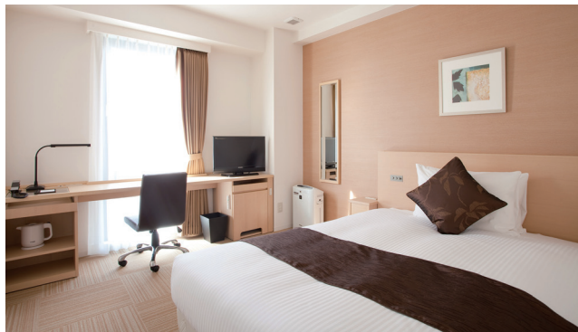
SINGLE ROOM シングルルーム 125室